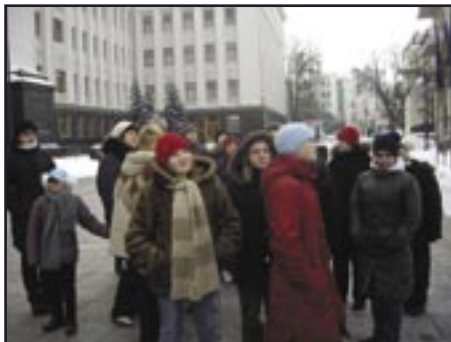
На день треба дивитись, як на маленьке життя М. Горький

Один незабутній день у столиці мають змогу провести вихованці дитячих будинків завдяки зусиллям волонтерів Київського благодійного театру та підтримці закладів, які люб'язно запрошують до себе у гості!